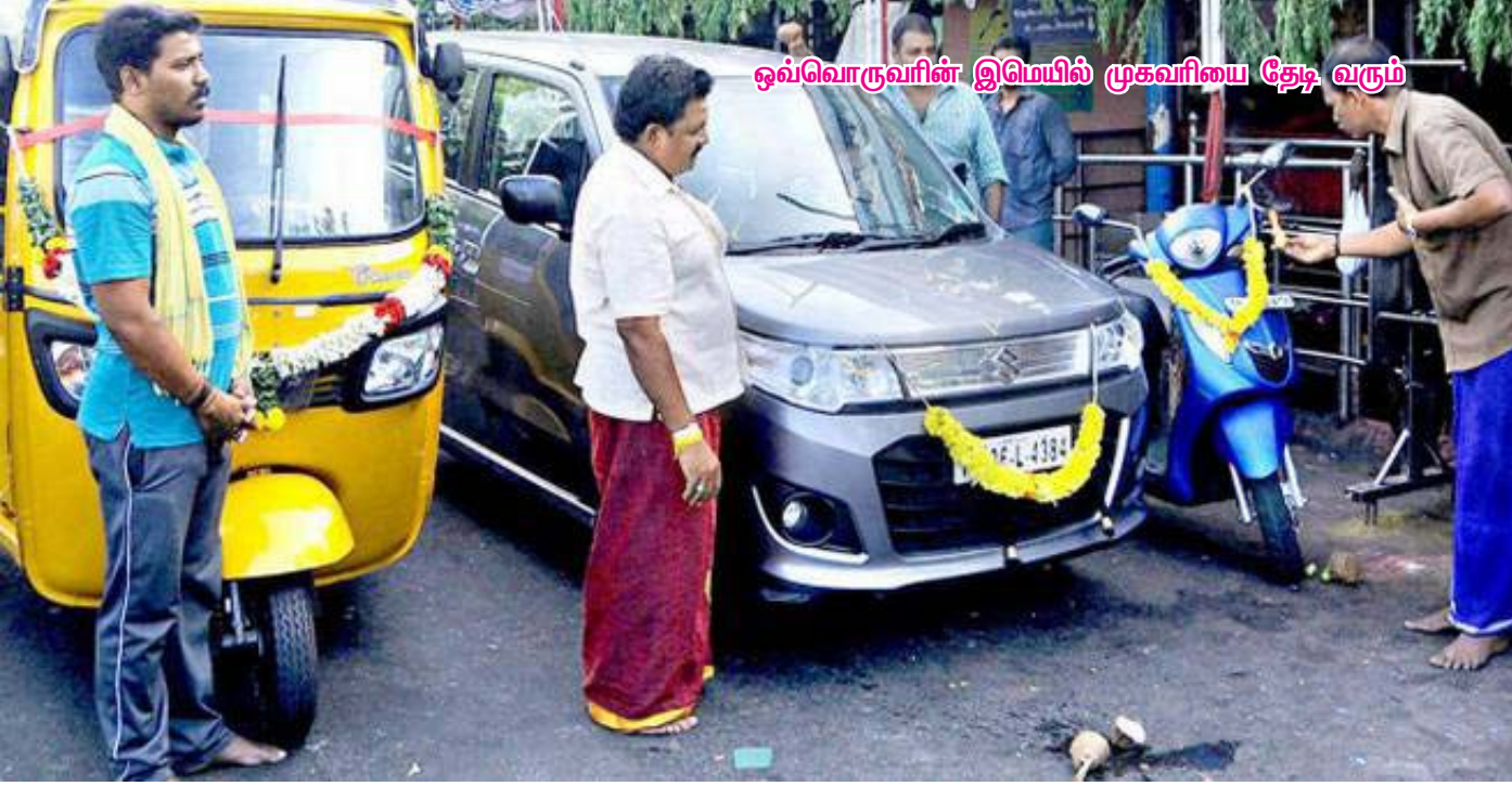
ஓவ்வொருவரின் இமெயில் முகவரியை தேடி வரும்